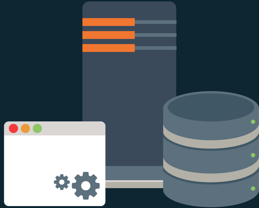
Servidor de aplicaciones y base de datos